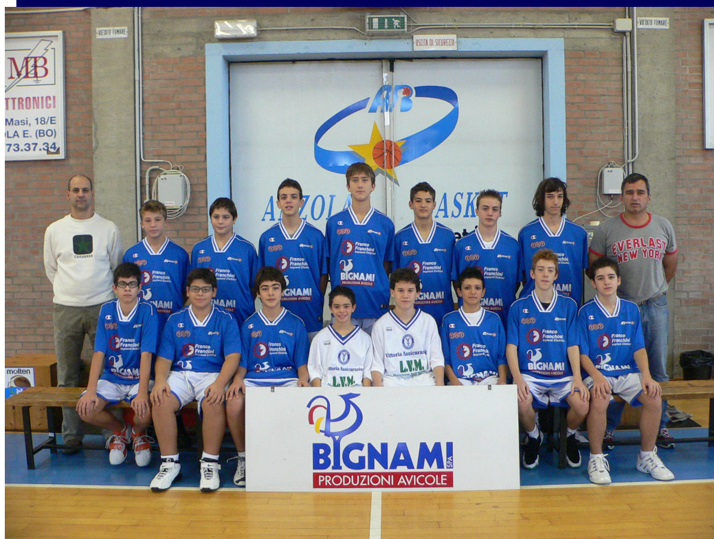
FOTO Squadra U 14