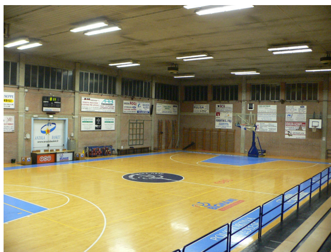
Il Palazzetto Comunale dell' ANZOLA BASKET